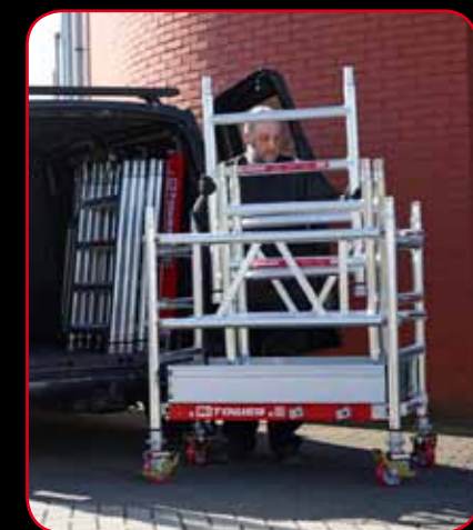
Transport simple et compact