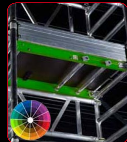
Options d'identification : nom/logo/couleurs