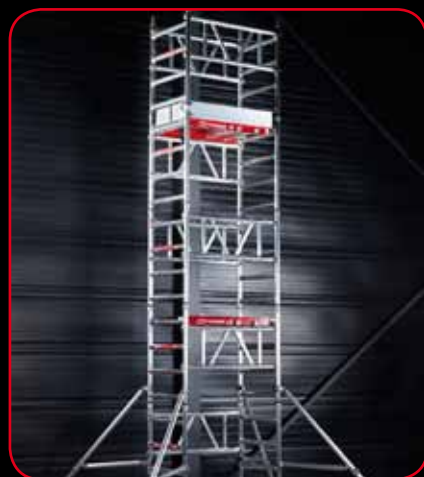
Hauteur de travail de 6 mètres (4 et 5 mètres également possibles)