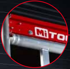
Plate-forme avec profilés rouges et code QR : vidéo et notice de montage et d'utilisation

Système de plinthes légères : léger, pliable, 1 ensemble