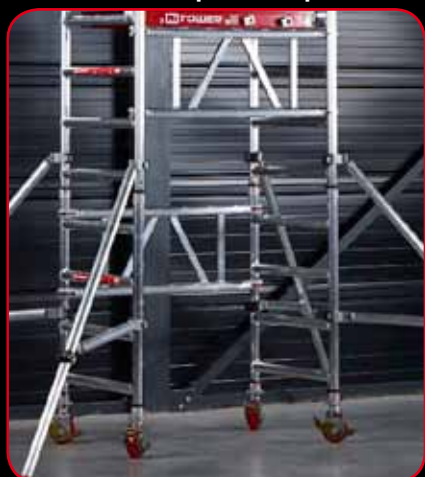
Peu d'encombrement au sol