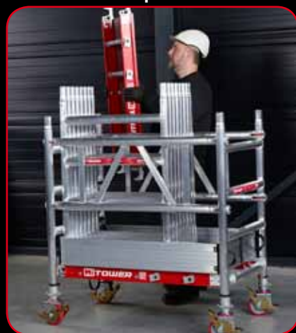
Chariot avec propre matériel