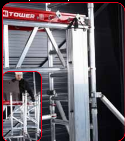
Plate-forme avec crochets à matériel de conception unique